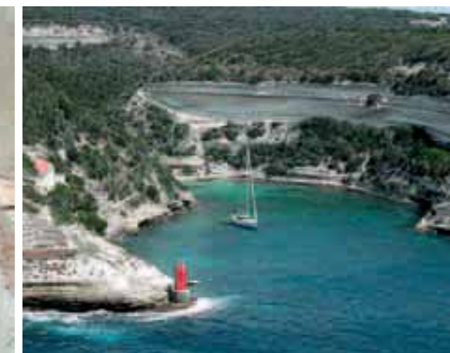
Suggestivo scorcio della rocca di Bonifacio (a sinistra). Sopra, una delle piccole ed accoglienti cale che si aprono vicino al fiordo di Bonifacio

può ospitare solo natanti, quindi barche fino a 10 metri di lunghezza. Meteo permettendo, però, la bellezza del piccolo borgo suggerisce, se impossibile l'accesso al porto, almeno un breve ancoraggio nella bella Baie de Centuri. In fondo, la tappa successiva dista solo 18 miglia!