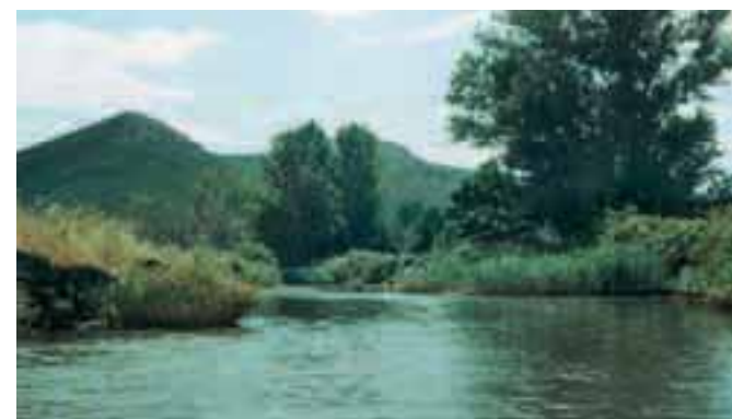
Sopra, un momento della risalita del Rio Alisio. Al tramonto, le Iles Sanguinaires si tingono di rosso creando un paesaggio molto suggestivo

Nel primo caso, dal paese parte un sentiero che seguendo la costa