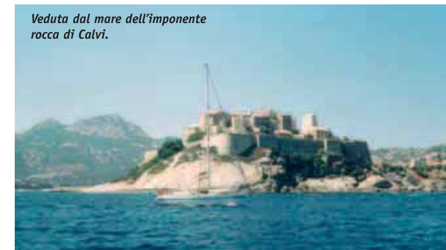
Veduta dal mare dell'imponente rocca di Calvi.