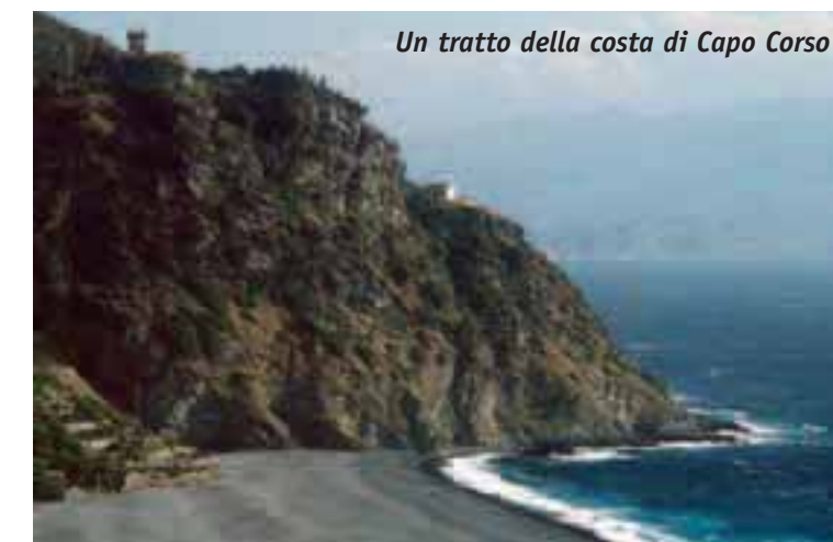
Un tratto della costa di Capo Corso

Trentuno miglia, una costa che gradatamente cambia diventando meno aspra e scoscesa. Le classiche scogliere granitiche del nord, prima mutano in un'area collinare che si spegne su spiagge di ciottoli; poi, tornano, improvvisamente nella zona delle Bocche, a esprimersi con alte e candide scogliere calcaree ricche di rade e profonde insenature. Quasi tutto questo tratto di costa è tanto bello quanto insidioso se si desidera navigare molto vicini a esso. Le centinaia di splendide calette sono "gelosamente protette" da scogli ➤