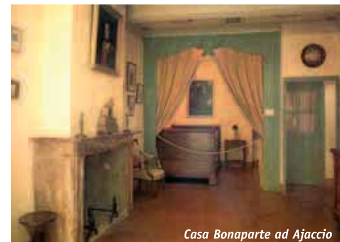
Casa Bonaparte ad Ajaccio

Sbarcati a Calvi, la bellezza e l'estrema vitalità dell'arroccata cit-