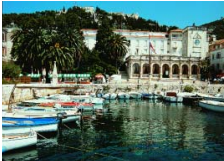
Il porto di Hvar, elegante e modaiolo centro dell'isola omonima