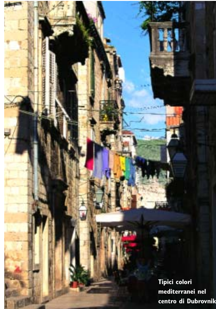
Tipici colori mediterranei nel centro di Dubrovnik

• Tutte le maggiori agenzie di charter offrono imbarcazioni delle compagnie internazionali con base in Dalmazia. Dall'Italia i porti più vicini al sud Dalmazia sono Vieste (60 miglia da Lastovo), Trani (88 miglia da Lastovo) e Bari (104 miglia da Dubrovnik). www.alisei.com info@alisei.com