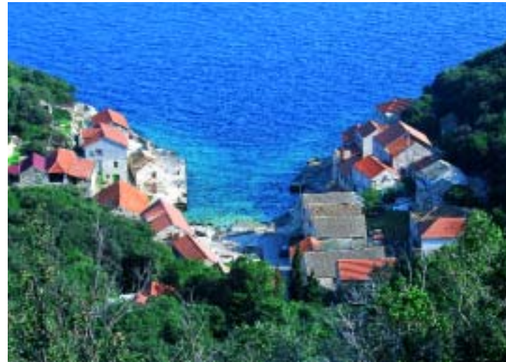
Il minuscolo villaggio di Lucica, nella costa settentrionale di Lastovo