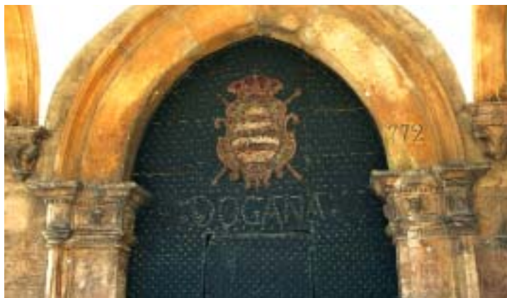
Angoli italiani a Dubrovnik, capoluogo della Dalmazia meridionale