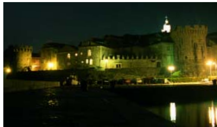
Notturmo sulla cittadina di Korcula, splendida nella sua eredità veneziana