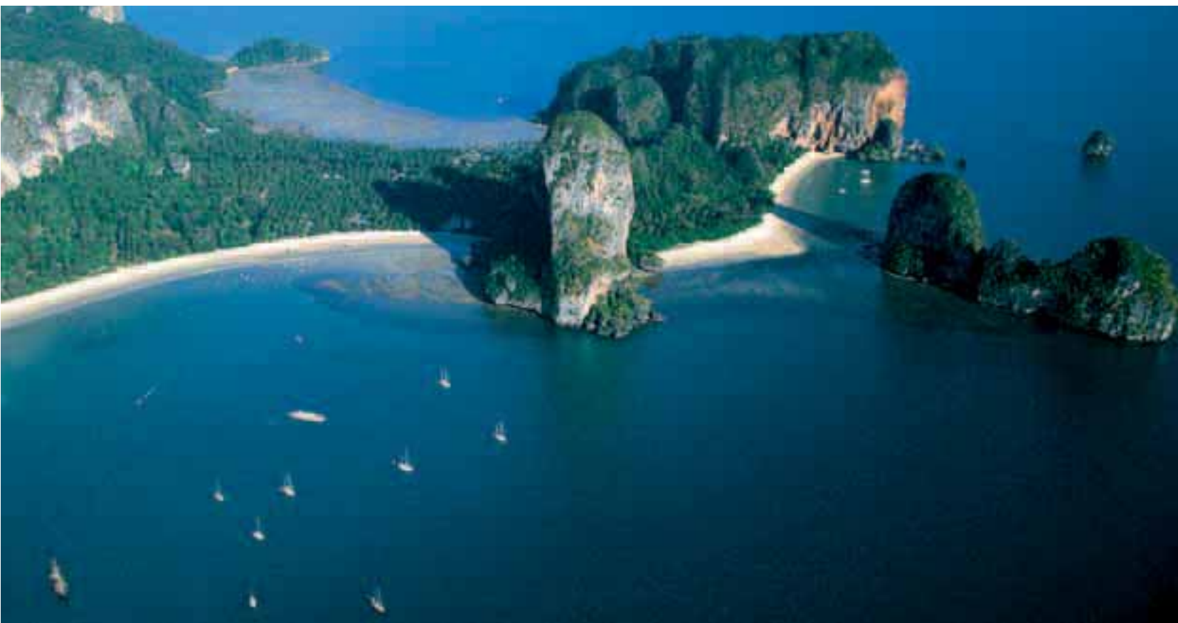
Un angolo della costa del Krabi, la regione sulla penisola thailandese a est di Phuket. Sono molte le isolette che si possono raggiungere, sicuri di trovare un mare come quello che si vede a sinistra e in basso