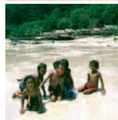
Bambini che si divertono nelle acque della baia di Phang Nga, fotografata dall'alto a destra