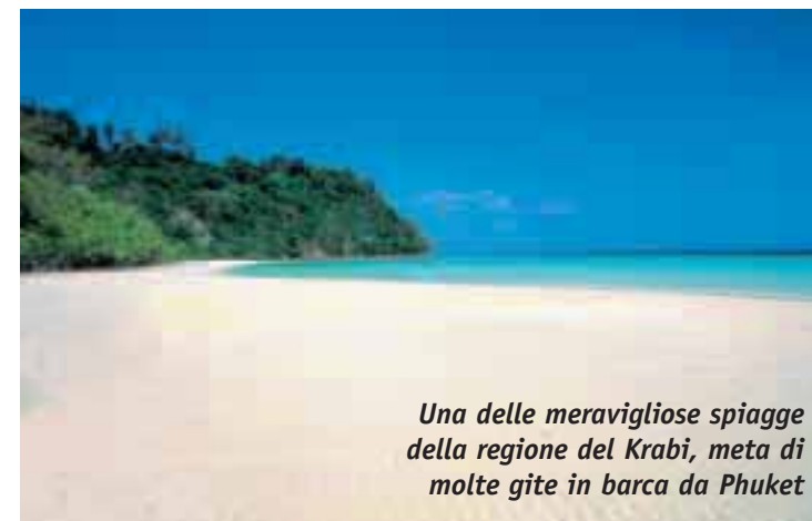
Una delle meravigliose spiagge della regione del Krabi, meta di molte gite in barca da Phuket