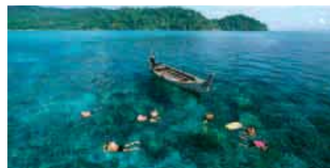
In alto e a destra, gli scenari da sogno di Phuket. A sinistra e in basso la baia di Phang Nga