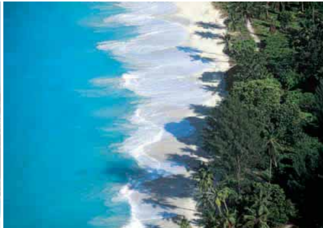
Palme, sabbia bianca e tiepide acque azzurre: ecco lo scenario che le Seychelles regalano ai turisti