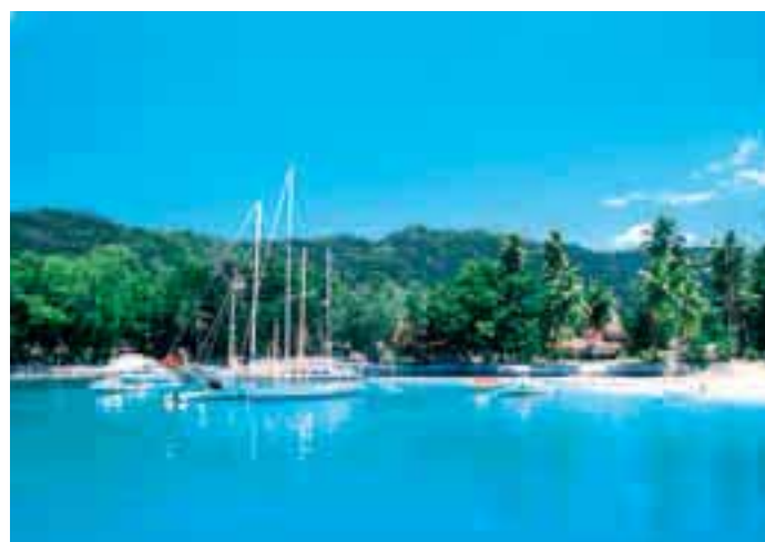
Quest'anno si è registrato un aumento nella richiesta di charter effettuati con yacht a vela. Le acque calme e i numerosi ridossi rendono affascinante e sicuro questo tipo di turismo

no mescolati pirati, schiavi dell'Africa e del Madagascar, e anche mercanti arabi e cinesi approdati qui per smerciare il riso. Infatti, le Isole erano disabitate quando Vasco de Gama per primo, nel 1502, diede notizia del loro avvistamento, anche se apparentemente erano già state frequentate dagli Arabi e dai Persiani nel XII secolo. Dopo la scoperta, esse rimasero dimenticate per più di un secolo, finché solo nel 1609 una spedizione al comando dell'inglese Alexander Sharpeig, colpita da una tempesta, si fermò per una decina di giorni nell'arcipelago. Da quel momento, per quasi centocinquanta anni, le Isole furono il rifugio preferito dei pirati, che vi nascondevano i loro tesori. Solo quando Mahe de Labourdonnais, nel 1742, ne agevolò il popolamento, facendovi arrivare coloni francesi