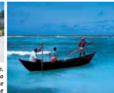
Immagini della popolazione locale. Caratteristici e pittoreschi restano sia gli usi che i costumi di queste solari popolazioni africane