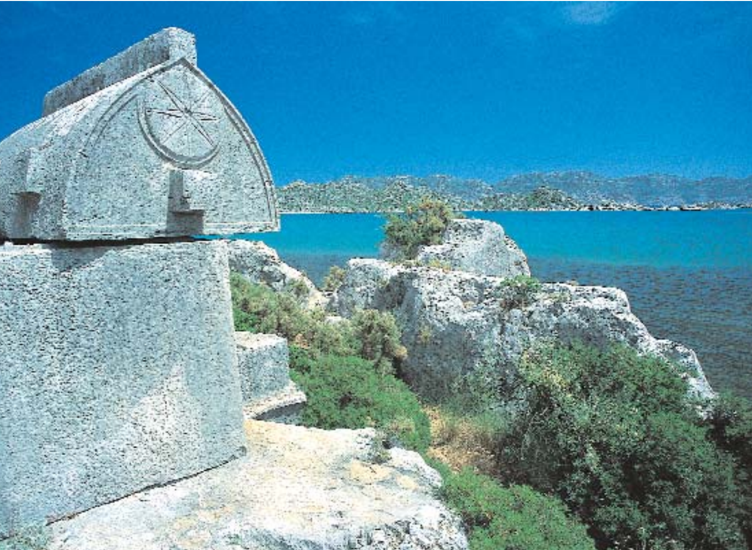
Uno dei tipici sarcofagi sparsi per la Licia. Qui siamo nel Golfo di Fethiye, uno dei paradisi della navigazione in Mediterraneo

Una volta era terra riservata solo ai pastori che, temendo il mare, preferivano arrampicarsi sugli impervi scoscesi che, dalle catene montuose, precipitano in un mare turchese e incontaminato. Molto tempo prima era stato il luogo dove erano sorte splendide città ellenistiche. Pochi lustri or sono, qualche velista anglosassone in cerca di novità ne è rimasto così affascinato da non lasciarne più i lidi. Oggi è uno degli ultimi paradisi della navigazione in Mediterraneo. La Licia, anticipata seppur in non egual fascinosa misura dalla Caria, fa della Turchia mediterranea una zona ideale per chi, navigando a vela, cerchi pace, dolci venti e atmosfere diverse. La zona, negli ultimi dieci anni, si è anche dotata di infrastrutture nautiche moderne che consentono un agevole cabotaggio lungo costa. La varietà degli ambienti, poi, almeno per chi voglia lasciare le rotte consuete, è tale da garantire crociere, da una settimana a un mese di durata, dove la noia non è un problema. Dai luoghi solitari si passa ai porti con passeggiate e lo-