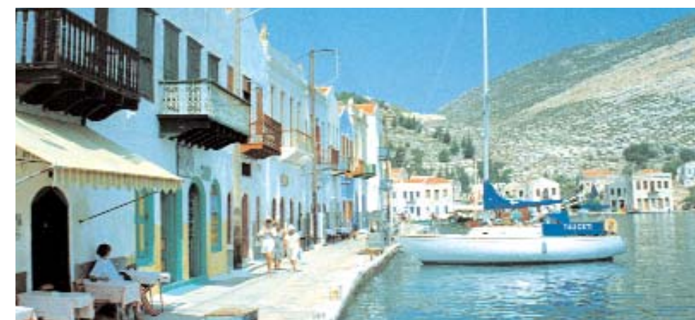
Kastellorizo, ultima isola del Dodecanneso greco, segna il confine orientale dell'Europa mediterranea. In alto: l'idilliaco porto naturale. Sopra: scena di vita in banchina

alle Isole Sehir (2), dove potrete rivivere (almeno in primavera e autunno) le sensazioni di Antonio e Cleopatra, che amoreggiavano da queste parti. Uno spettacolare labirinto di cale, seminasoste tra i boschi, si apre subito a ovest, con Degirmen Buku (English Harbour), Kargilibuk e, subito prima dell'inizio della lunga penisola di Datca, Yedi Adalar (3). Nella zona, sarà il caso di mettere subito in pratica la tecnica di ormeggio locale, con ancora e tonneggio a terra con cima legata a uno dei pini o alberi che orlano la riva. Sul successivo tratto settentrionale della penisola occorrerà prestare attenzione, visto che la zona è esposta alle raffiche del vento da nord. La tappa successiva sarà necessariamente Cnidos, l'antica città ellenistica che sin dal IV Secolo a.C. sorge sulle pendici della penisola di Capo Krio. La suggestione del luogo è enorme, specialmente se la sosta sarà accompagnata dalle raffiche di Meltemi che precipitano dal varco su cui sorge lo spettacolare teatro. In Egeo, forse solo il Tempio di Apollo, a Capo Suni (in Attica), può rivaleggiare per scenografia nautico-archeologica con questo luogo. L'ancoraggio, per