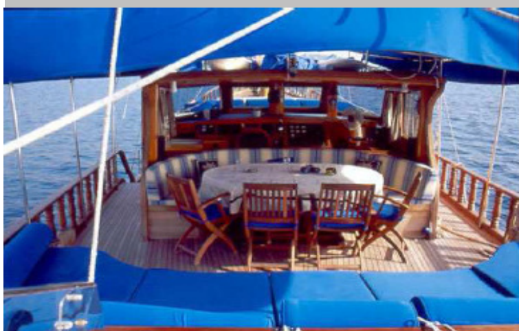
Vita a bordo