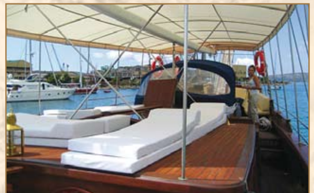
Paluba – il bordo : Provate l'esperienza del calore di sole ed un abbraccio blu dell'Adriatico al bordo immenso della Blue Nose.