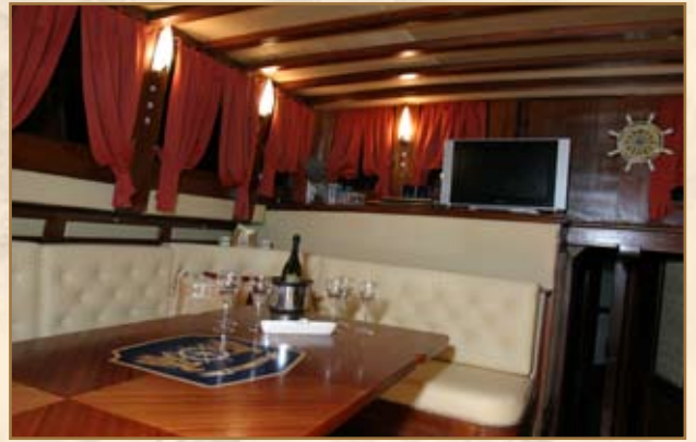
Salotto : Il vasto salotto per associarsi oppure per tenere le riunioni d'affari esprime il bianco lussuoso della pelle e dei cristalli Swarovski inseriti a mano.