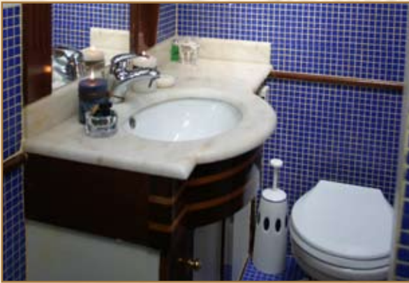
Bagno: Ogni cabina è adornata del blu marittimo di un bagno prestigioso.