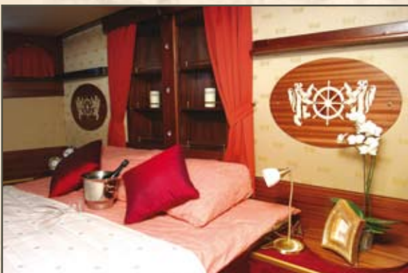
Suite presidenziale – Dettagli scelti per il gusto scelto.